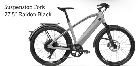
Suspension Fork 27.5" Raidon Black